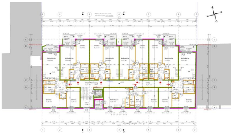
Grundriss Regelgeschoß ( 1.- 4.Stock ) 1:100